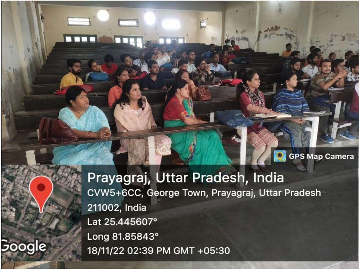
Photographs during the Programme