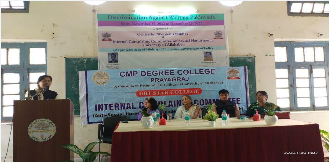
Photographs during the Programme