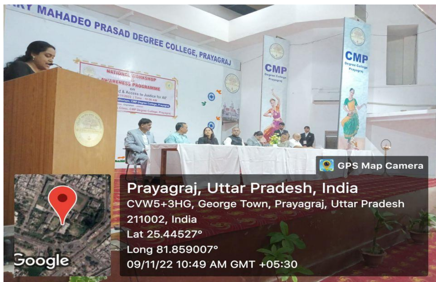
Photographs during the Programme