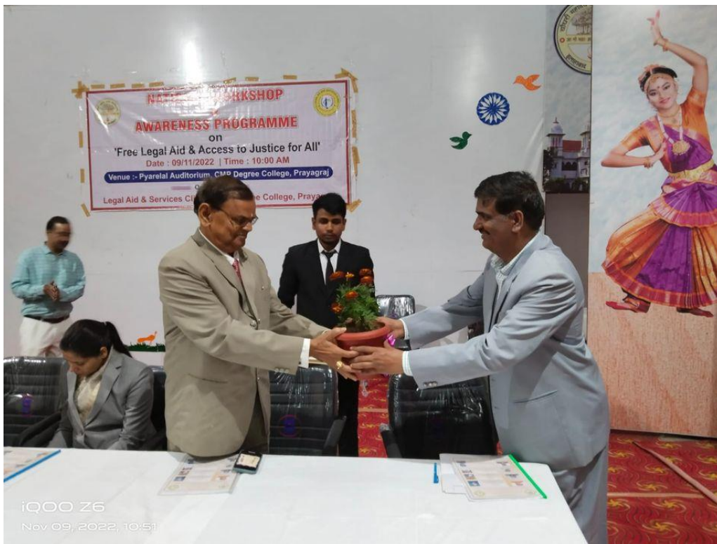
Photographs during the Programme