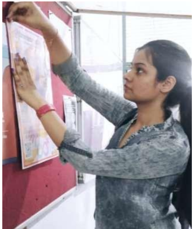
Photographs during the Events