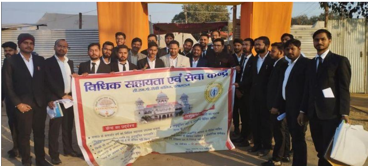
Photographs during the Programme