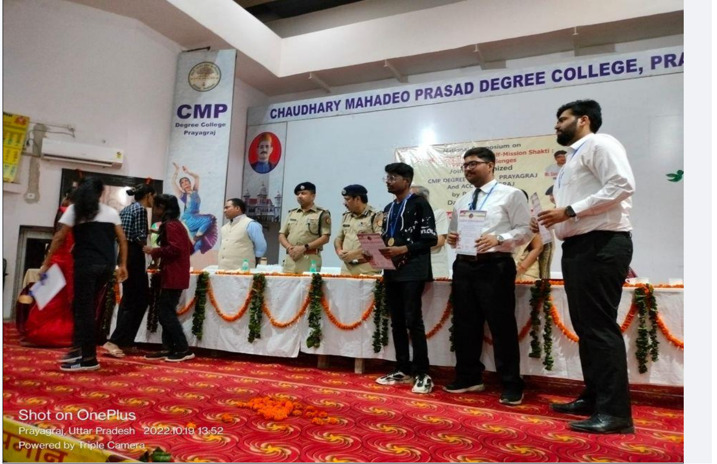
Photographs during the Programme