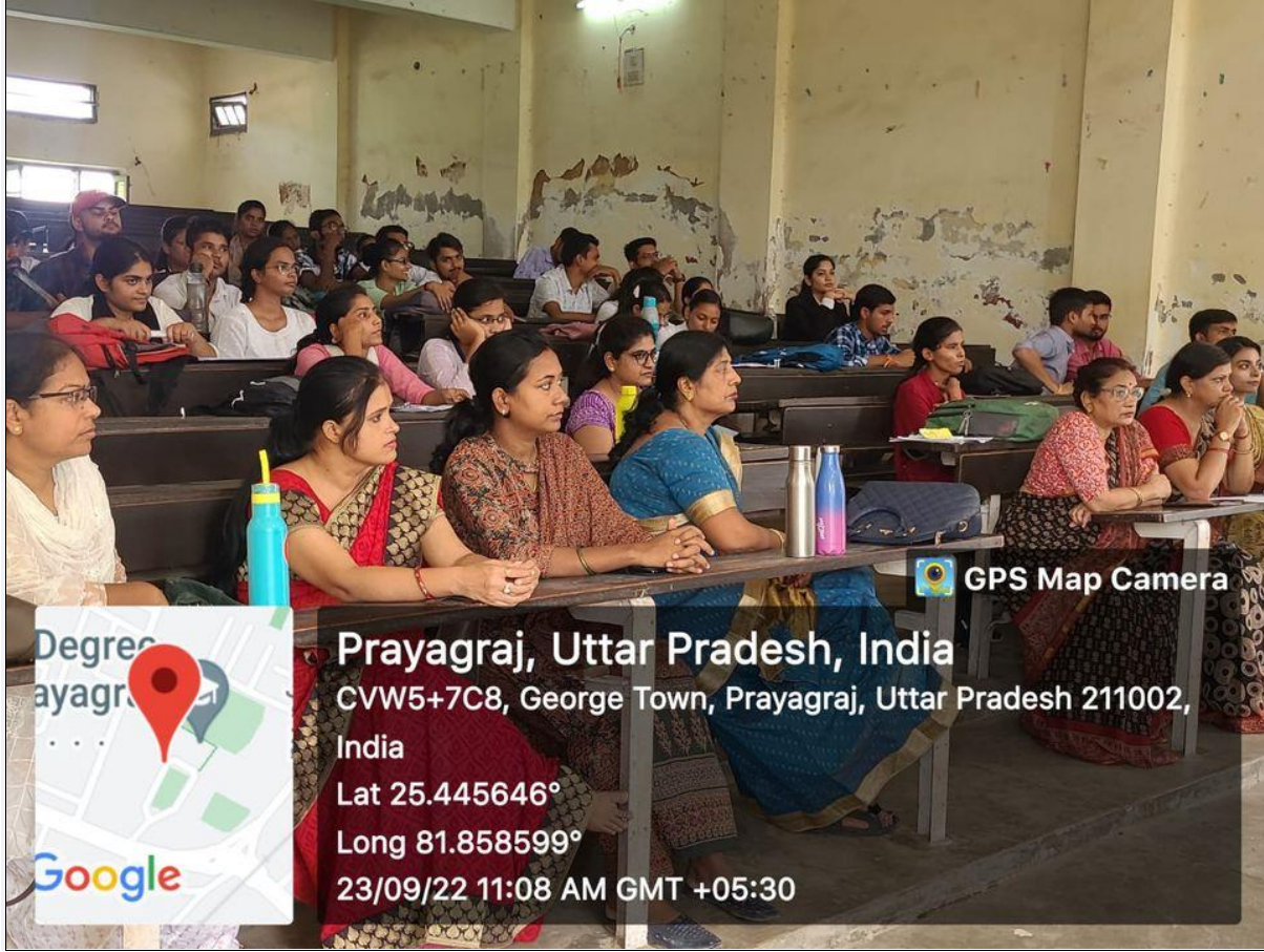
Photographs during the Programme