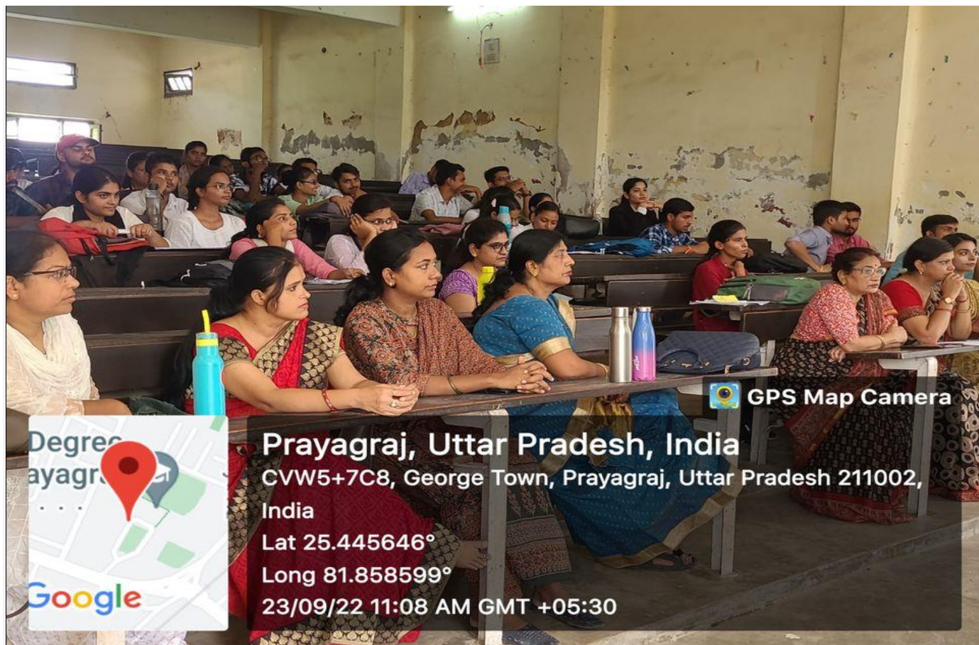
Photographs during the Programme