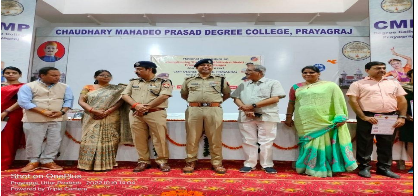
Photographs during the Programme