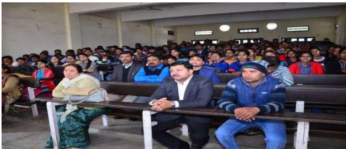
Brochure and Photographs during the Programme