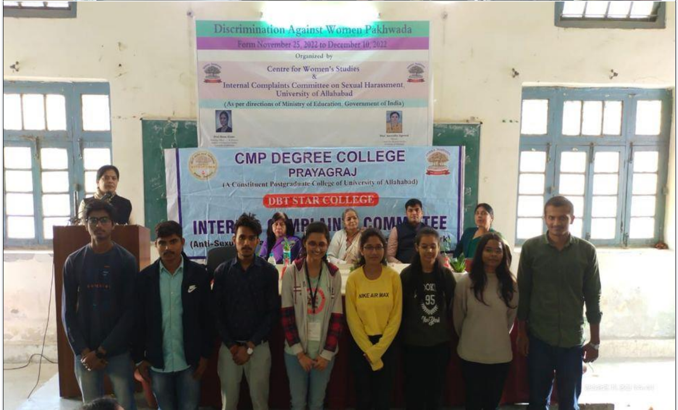
Photographs during the Programme