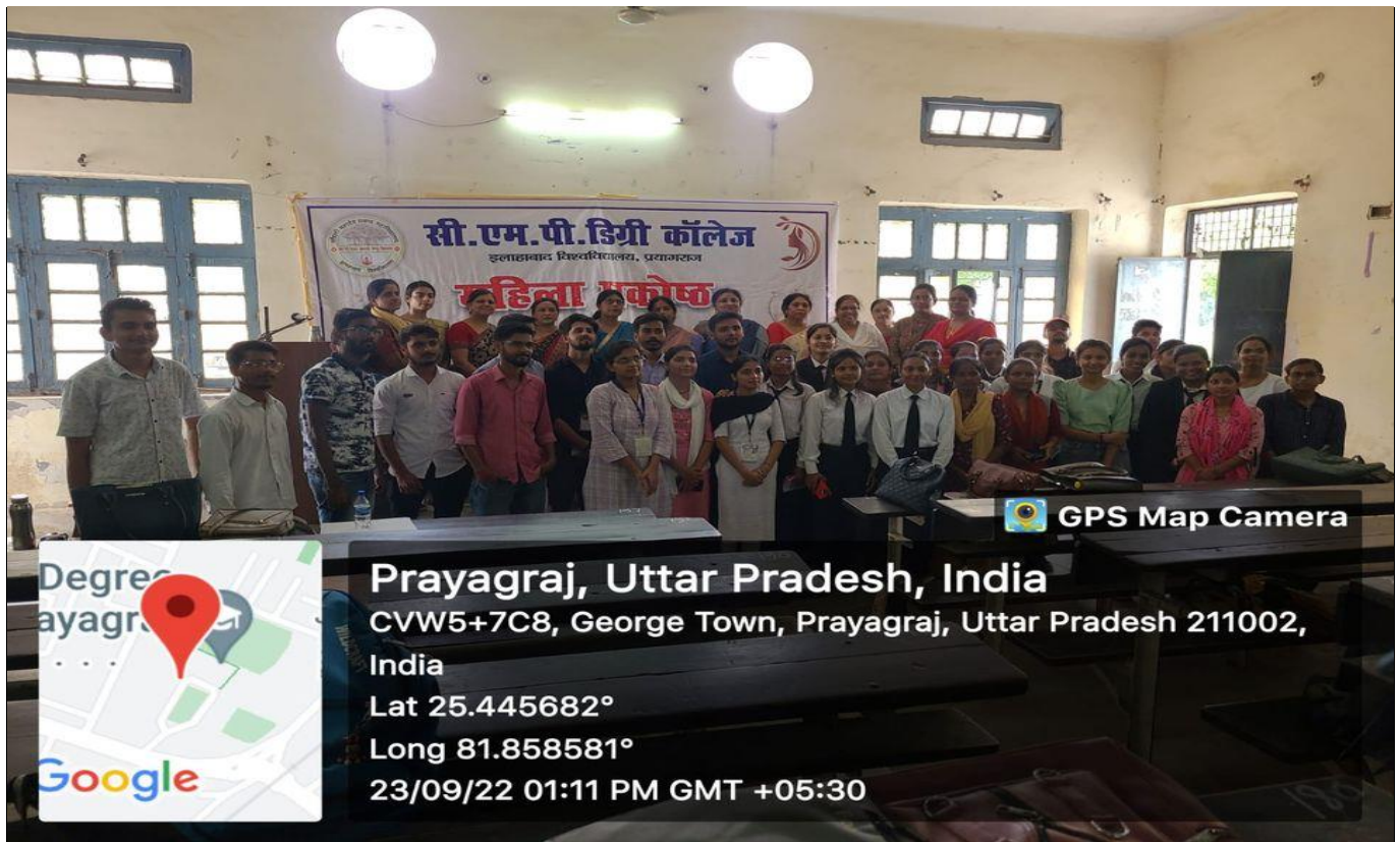
Photographs during the Programme