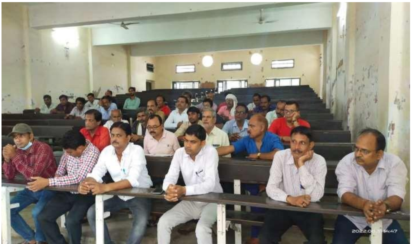
Photographs during the Programme