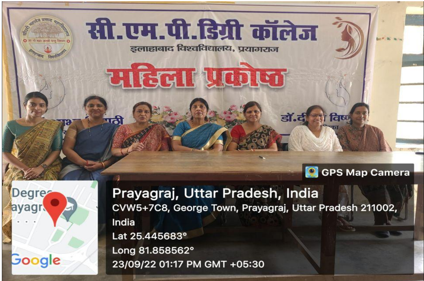
Photographs during the Programme