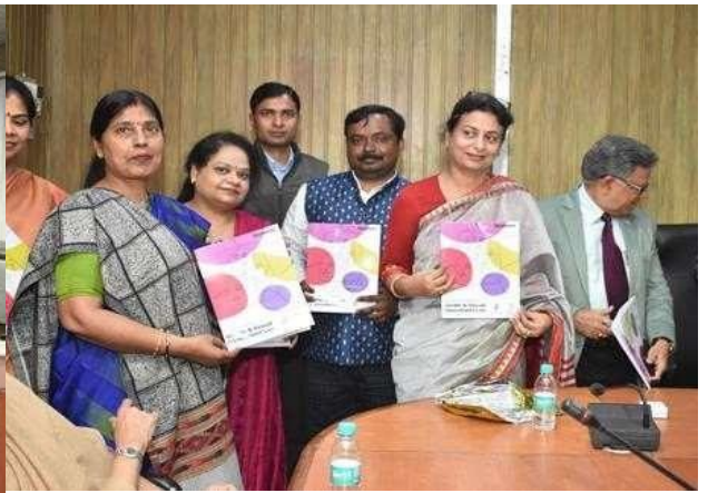
Photographs during the Programme