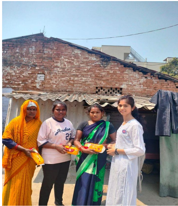
Photographs during distributing the Sanitary Pads in the Slum Areas